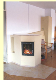
Ofen mit Wasserführung Holzherd