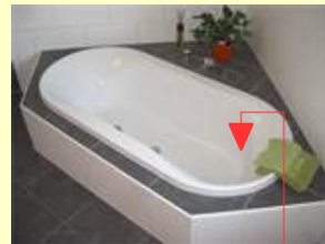
Warmwasser für Baden und Duschen